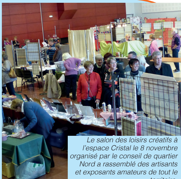
Le salon des loisirs créatifs à l'espace Cristal le 8 novembre organisé par le conseil de quartier Nord a rassemblé des artisans et exposants amateurs de tout le territoire.

Départ du 8 km le 15 novembre, les coureurs disputaient le challenge Alain Hartz sous un beau soleil.