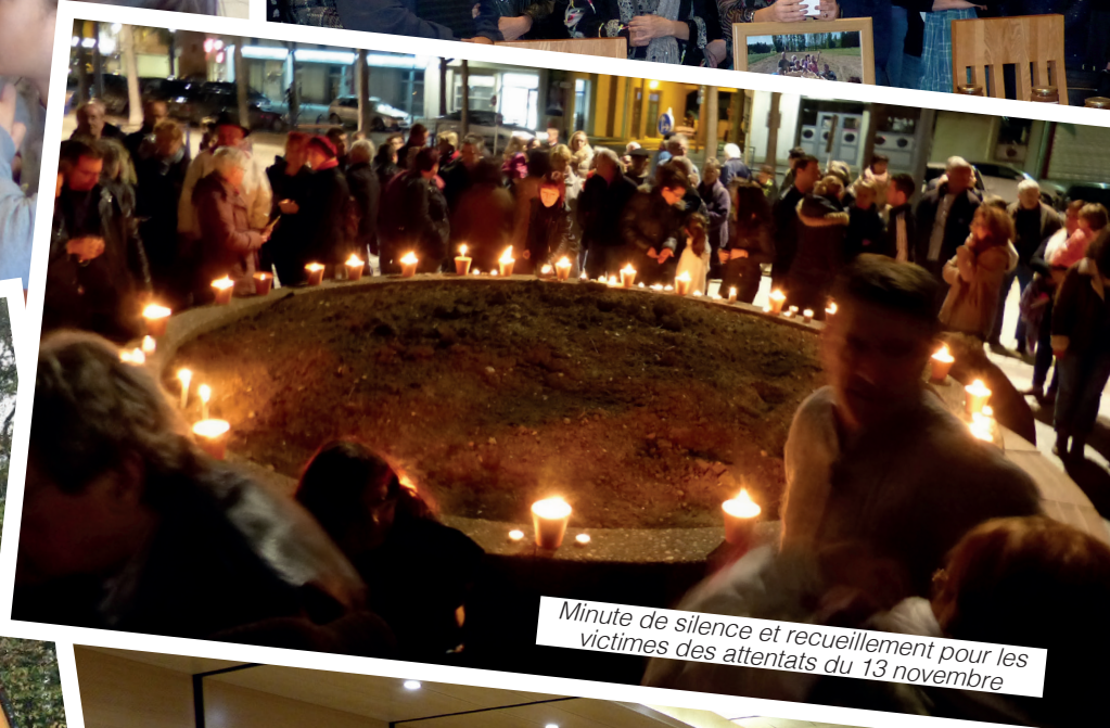
Minute de silence et recueillement pour les victimes des attentats du 13 novembre