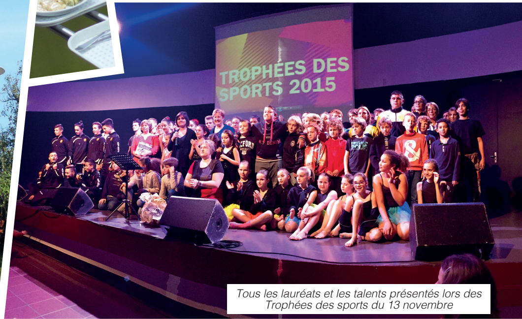
Tous les lauréats et les talents présentés lors des Trophées des sports du 13 novembre