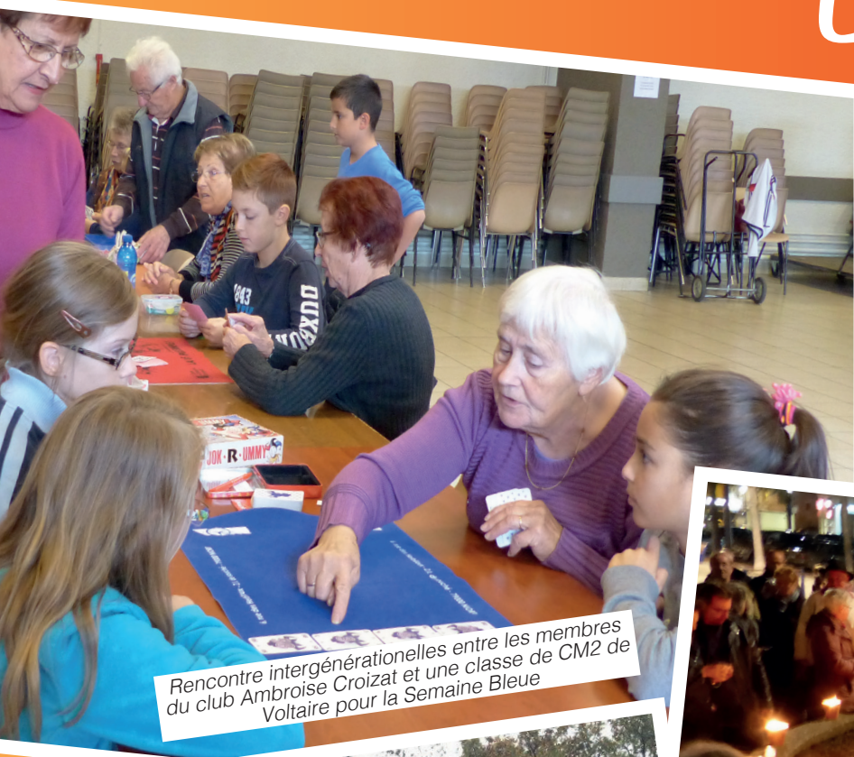
Rencontre intergénérationnelles entre les membres du club Ambroise Croizat et une classe de CM2 de Voltaire pour la Semaine Bleue