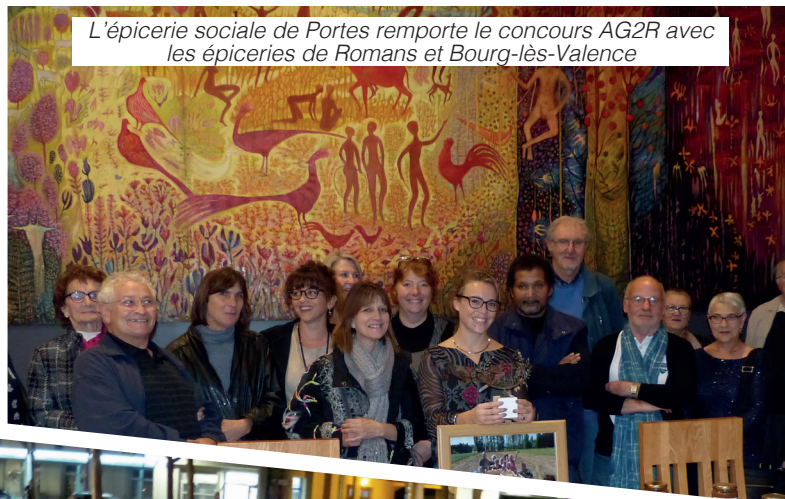
L'épicerie sociale de Portes remporte le concours AG2R avec les épicerie de Romans et Bourg-lès-Valence