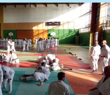
La plateforme Kata organisée, samedi 14 novembre à la Halle des Sports par le Judo Jujitsu Taïso a rassemblé près d'une centaine de passionnés