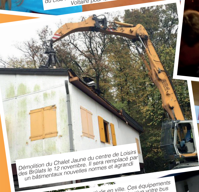
Démolition du Chalet Jaune du centre de Loisirs des Brûlats le 12 novembre. Il sera remplacé par un bâtimentaux nouvelles normes et agrandi