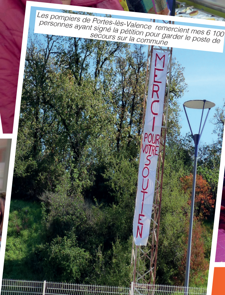
Les pompiers de Portes-lès-Valence remercient mes 6 100 personnes ayant signé la pétition pour garder le poste de secours sur la commune