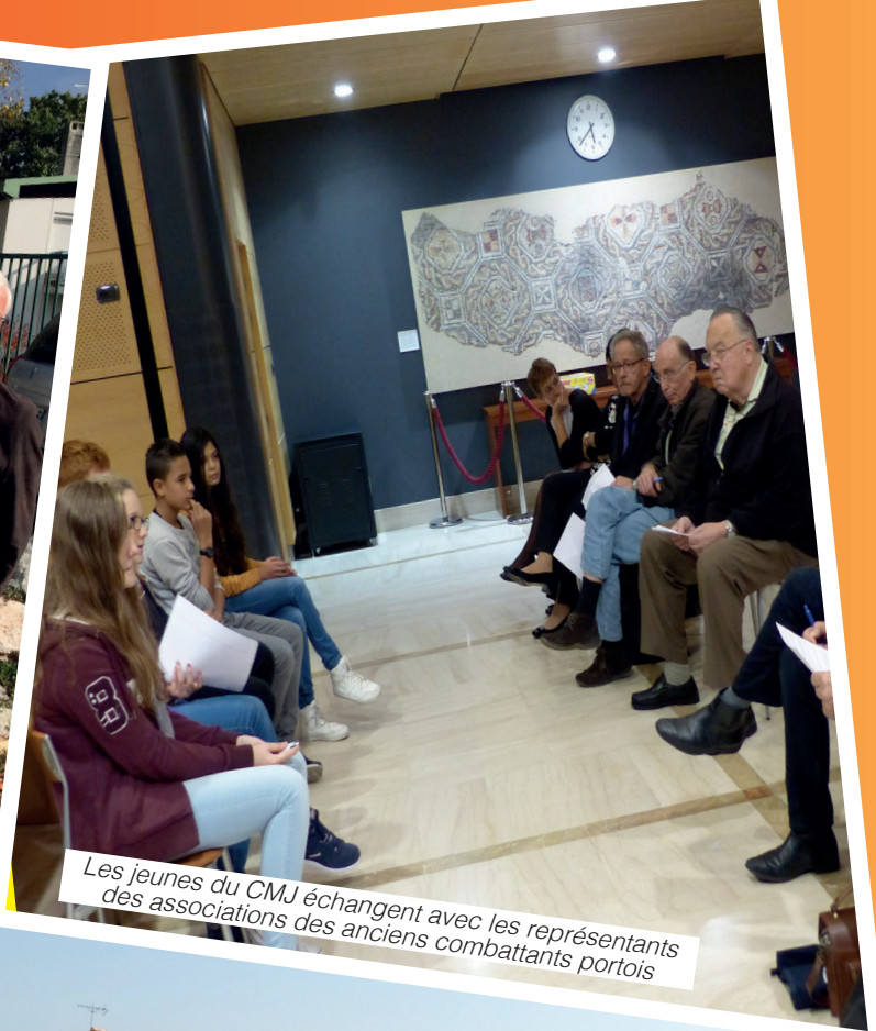
Les jeunes du CMJ échangent avec les représentants des associations des anciens combattants portois