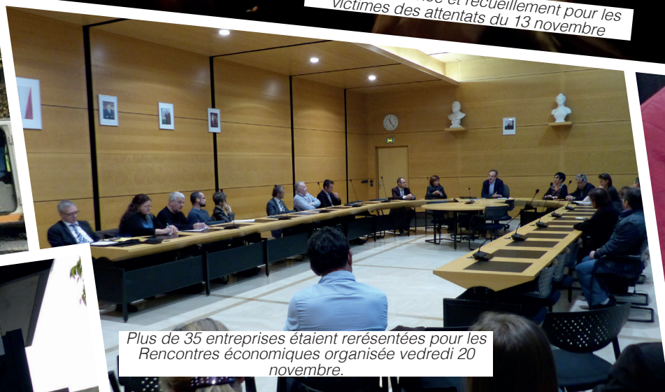
Plus de 35 entreprises étaient rerésentées pour les Rencontres économiques organisée vedredi 20 novembre.