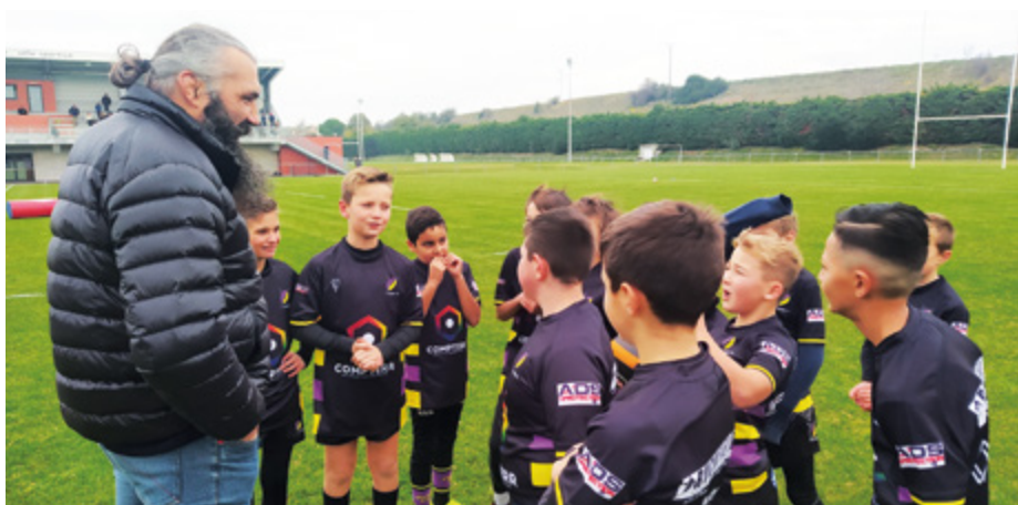
Sélectionné 62 fois en équipe de France, Sébastien Chabal a fait ses premières armes à Beauvallon. Il revient régulièrement rencontrer les jeunes de l'US Véore XV.

Parfaitement structuré avec une école de rugby d'un excellent niveau, des équipes U14, U16, U19 et des entraîneurs, l'US Véore XV peut raisonnablement espérer jouer les phases finales l'année prochaine et pourquoi pas, viser encore plus haut.