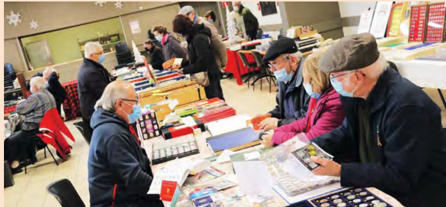
Numismates, pétrophiles, philatélistes ou encore discophiles, comprenez par là, collectionneurs de monnaies, de pierres, de timbres et de disques, s'étaient donnés rendez-vous à la salle Georges Brassens pour la bourse des collectionneurs, organisée par la MJC-Centre social. 12-12-2021