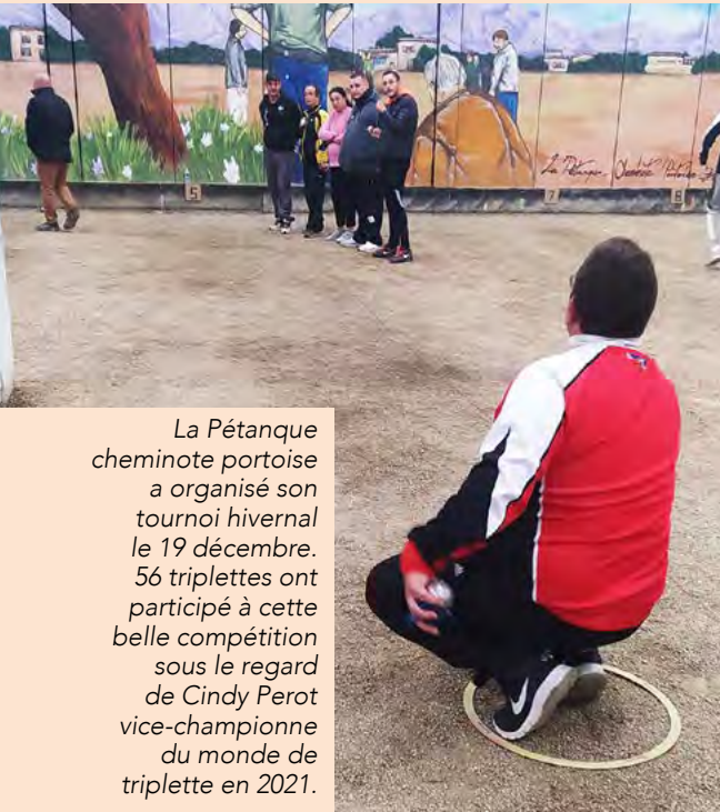
La Pétanque cheminote portoïse a organisé son tournoi hivernal le 19 décembre. 56 triplettes ont participé à cette belle compétition sous le regard de Cindy Perot vice-championne du monde de triplette en 2021.