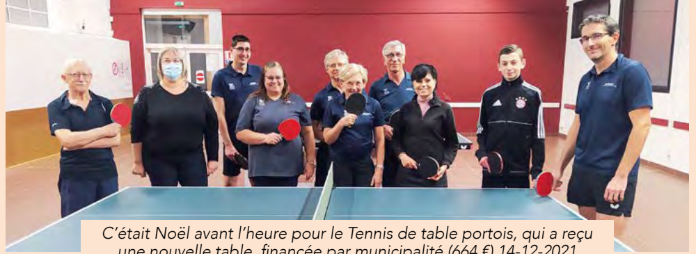
C'était Noël avant l'heure pour le Tennis de table portoïis, qui a reçu une nouvelle table, financée par municipalité (664 €). 14-12-2021