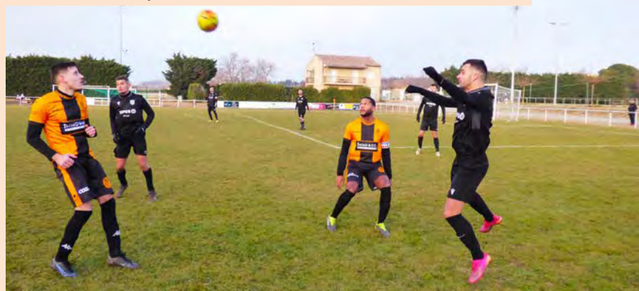
Pour son dernier match avant la trêve et par un froid glacial, le Football Club Portoïis recevait Privas. Menés 2 à 1 à la mi-temps, les Tango ont su égaliser et même mener avant de se faire rejoindre en fin de match. Score final 3-3. 19-12-2021