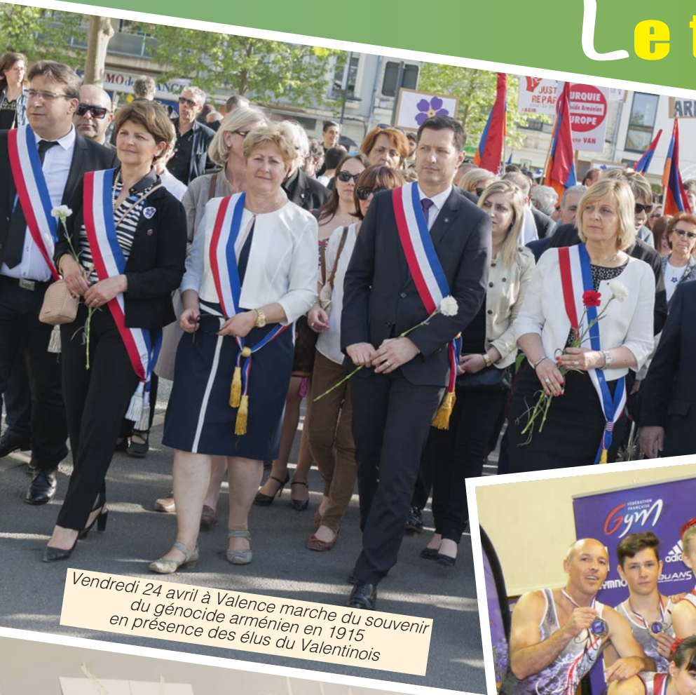
Vendredi 24 avril à Valence marche du souvenir du génocide arménien en 1915 en présence des élus du Valentinois