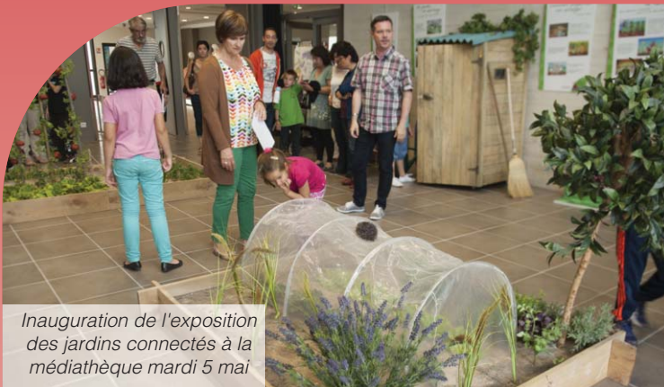
Inauguration de l'exposition des jardins connectés à la médiathèque mardi 5 mai