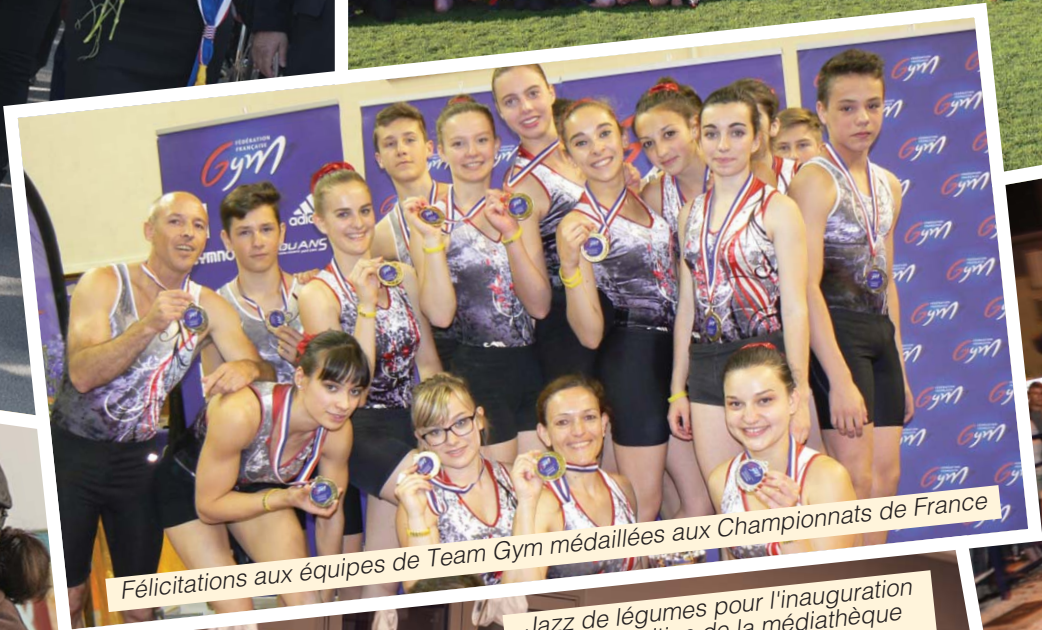
Félicitations aux équipes de Team Gym médaillées aux Championnats de France