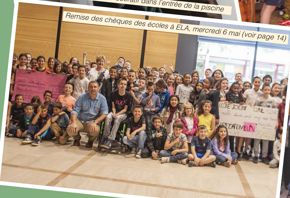
Remise des chèques des écoles à ELA, mercredi 6 mai (voir page 14)