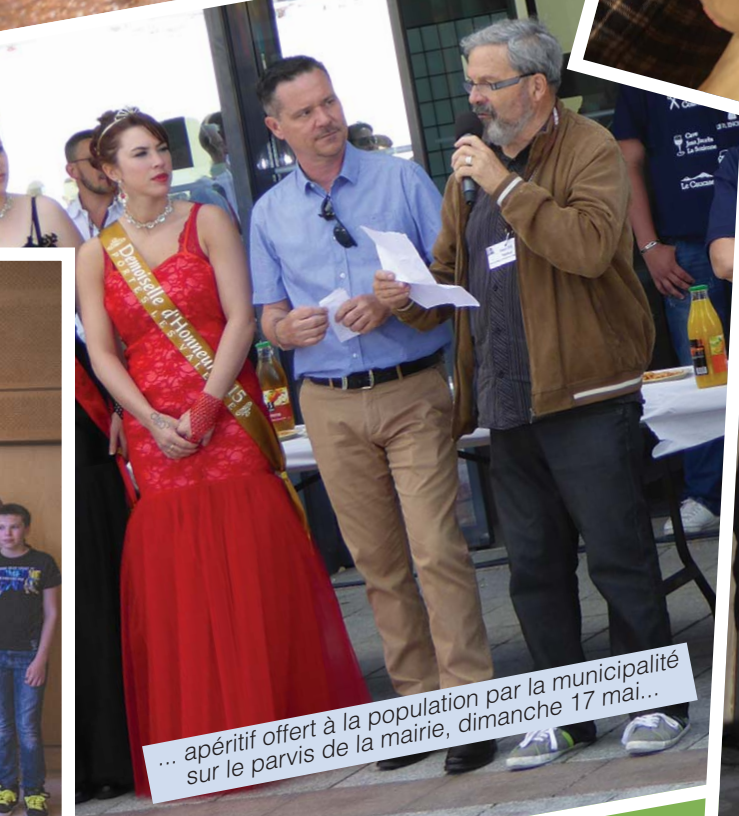
... apéritif offert à la population par la municipalité sur le parvis de la mairie, dimanche 17 mai...