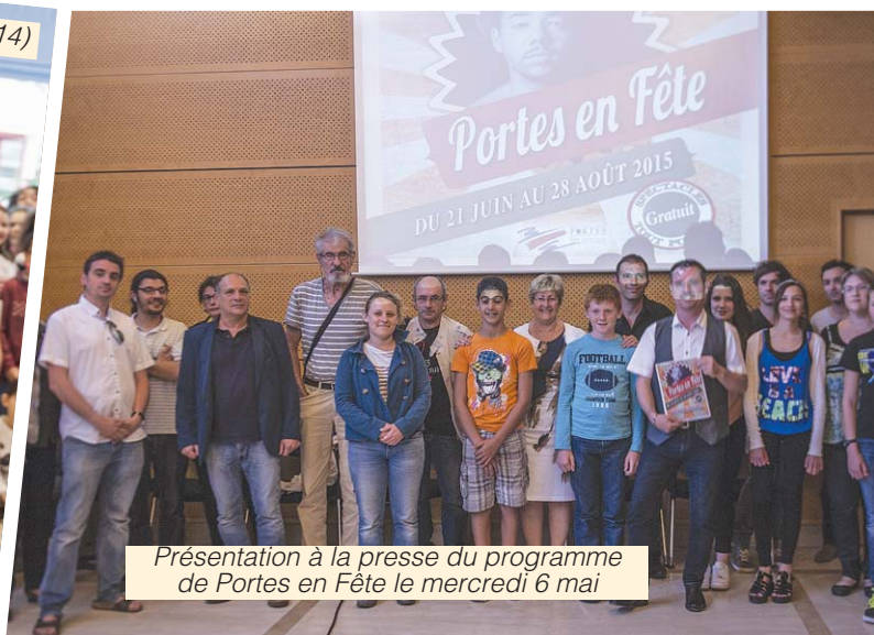
Présentation à la presse du programme de Portes en Fête le mercredi 6 mai