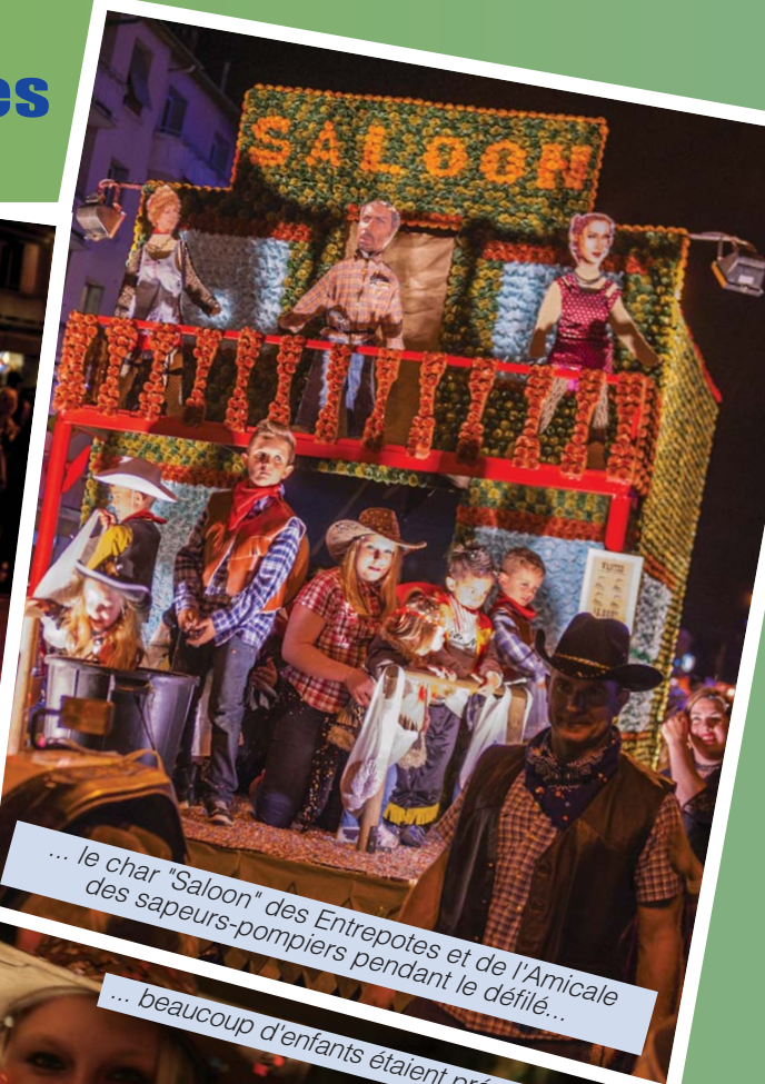
... le char "Saloon" des Entrepotes et de l'Amicale des sapeurs-pompiers pendant le défilé...