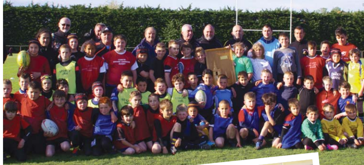
L'école intercommunale de rugby des moins de 12 ans de l'us Véore XV, lors du tournoi du Clocher à Grâne, le 25 avril