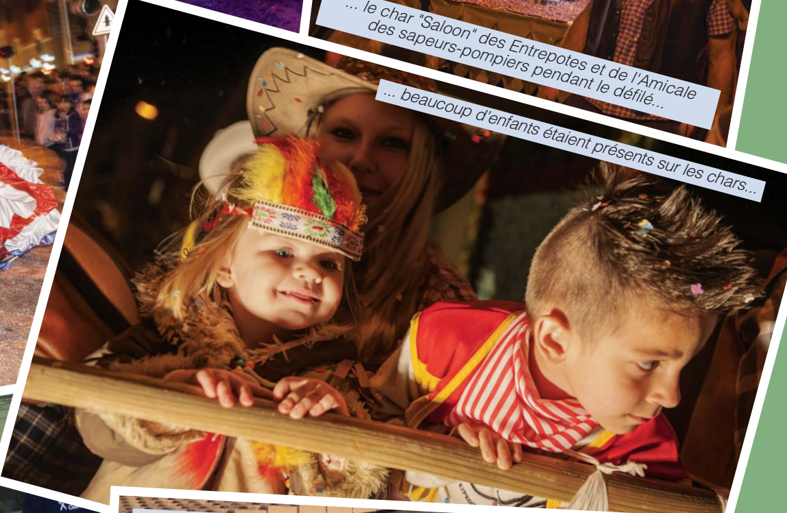
... beaucoup d'enfants étaient présents sur les chars...