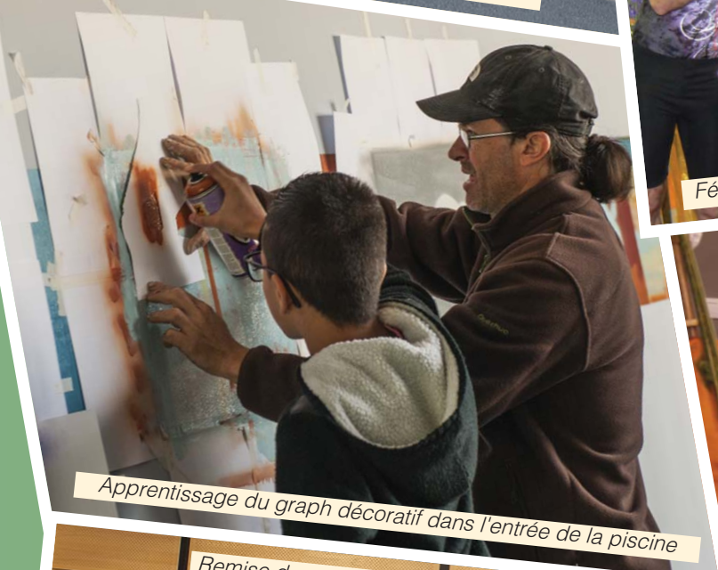
Apprentissage du graph décoratif dans l'entrée de la piscine