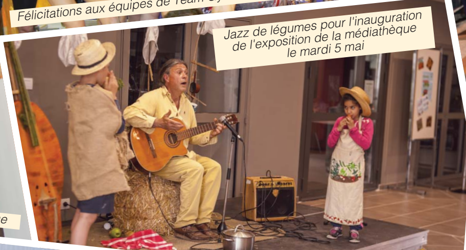
Jazz de légumes pour l'inauguration de l'exposition de la médiathèque le mardi 5 mai