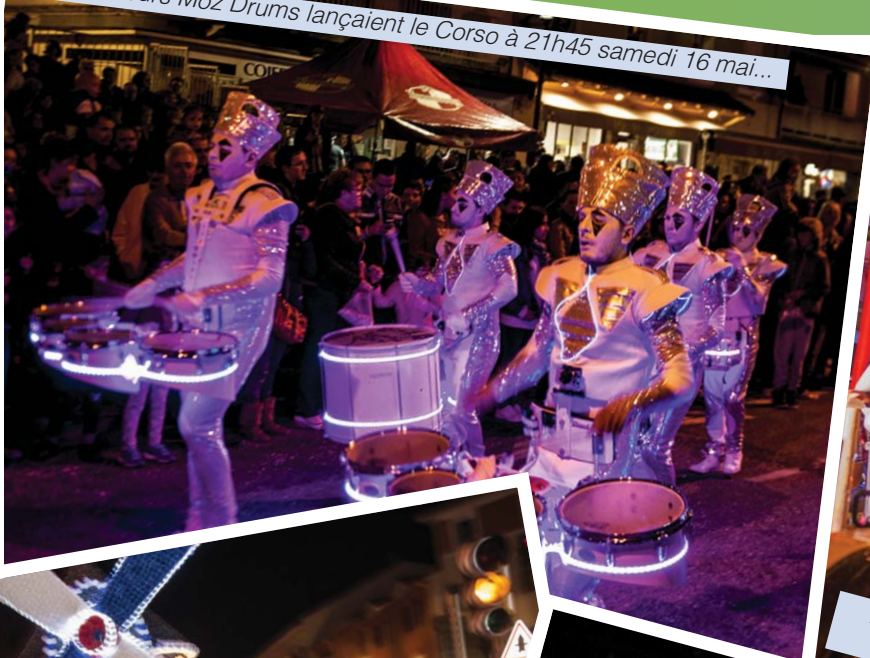
Les Batteurs Moz Drums lançaient le Corso à 21h45 samedi 16 mai...