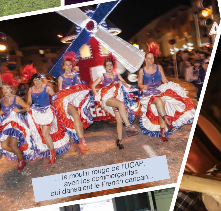
... le moulin rouge de l'UCAP, avec les commerçantes qui dansaient le French cancan...