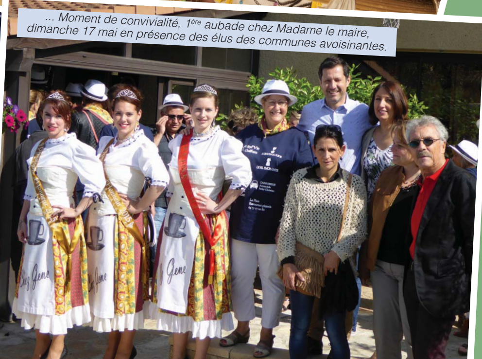
... Moment de convivialité, 1ère aubade chez Madame le maire, dimanche 17 mai en présence des élus des communes avoisinantes.