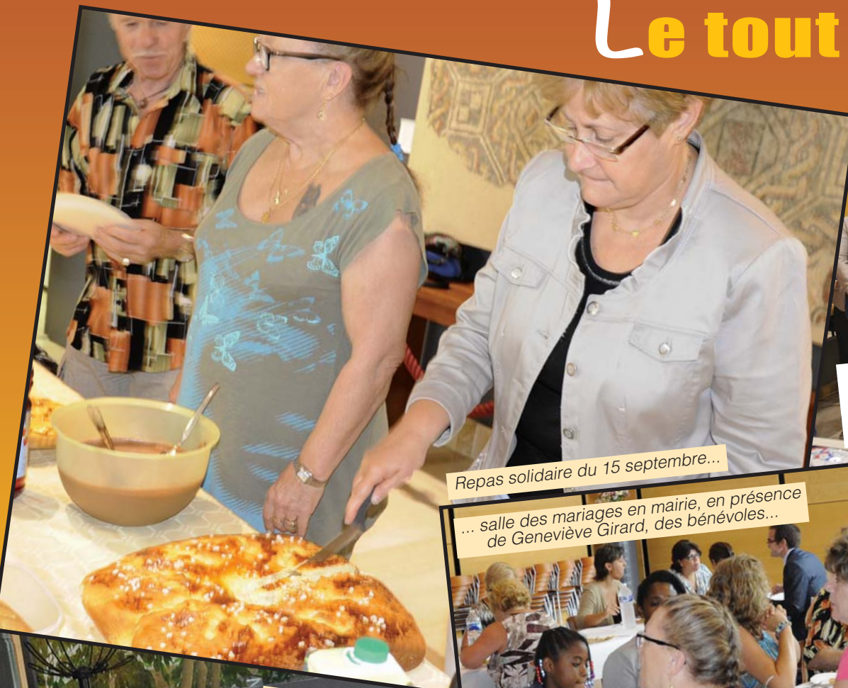
Repas solidaire du 15 septembre...