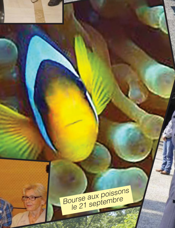
Bourse aux poissons le 21 septembre