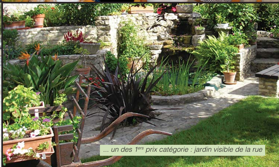
... un des 1 ers prix catégorie : jardin visible de la rue