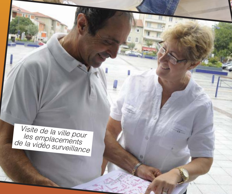
Visite de la ville pour les emplacements de la vidéo surveillance