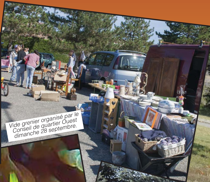
Vide grenier organisé par le Conseil de quartier Ouest dimanche 28 septembre.