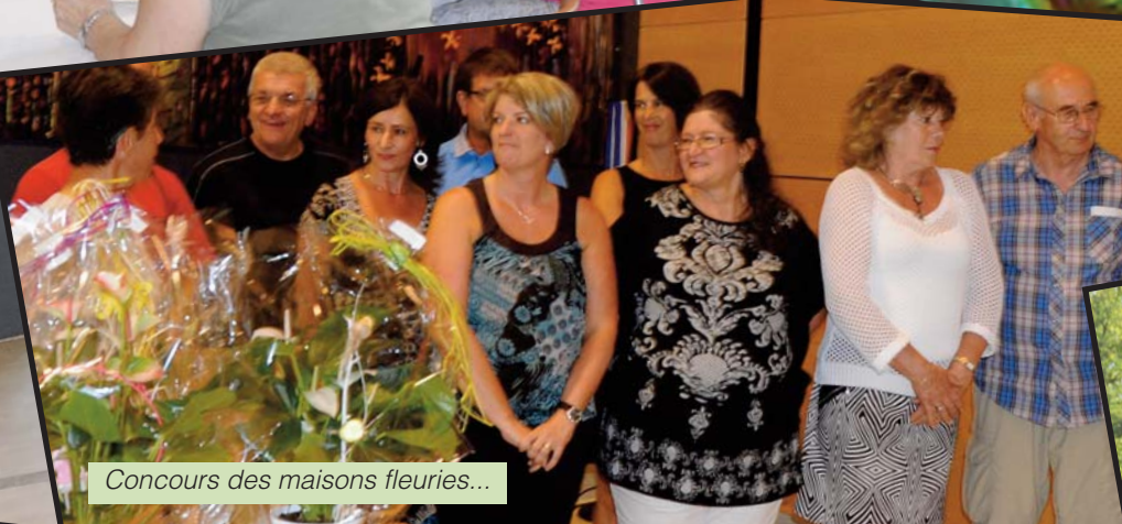
Concours des maisons fleuries...