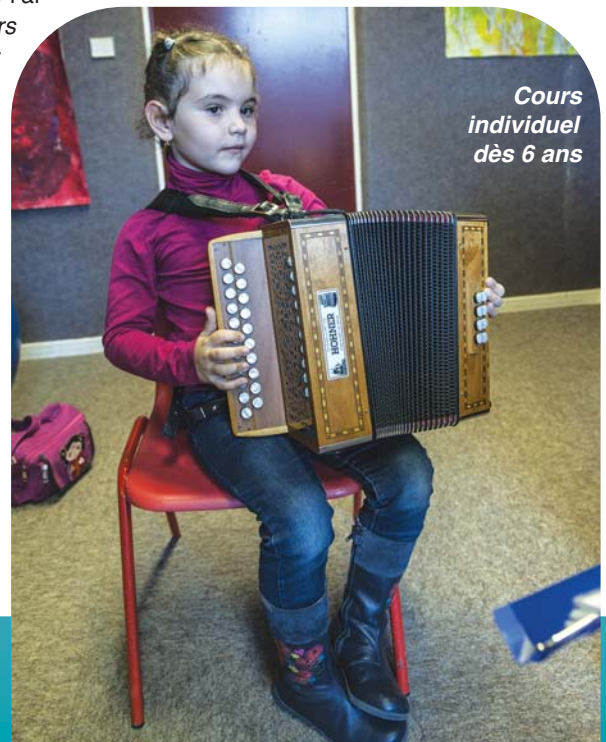
Cours individuel dès 6 ans

Pour tous renseignements, vous pouvez contacter l'école d'art au 04 75 57 31 54 et l'école de musique au 04 75 57 35 53, ou vous rendre au centre culturel L.Aragon.