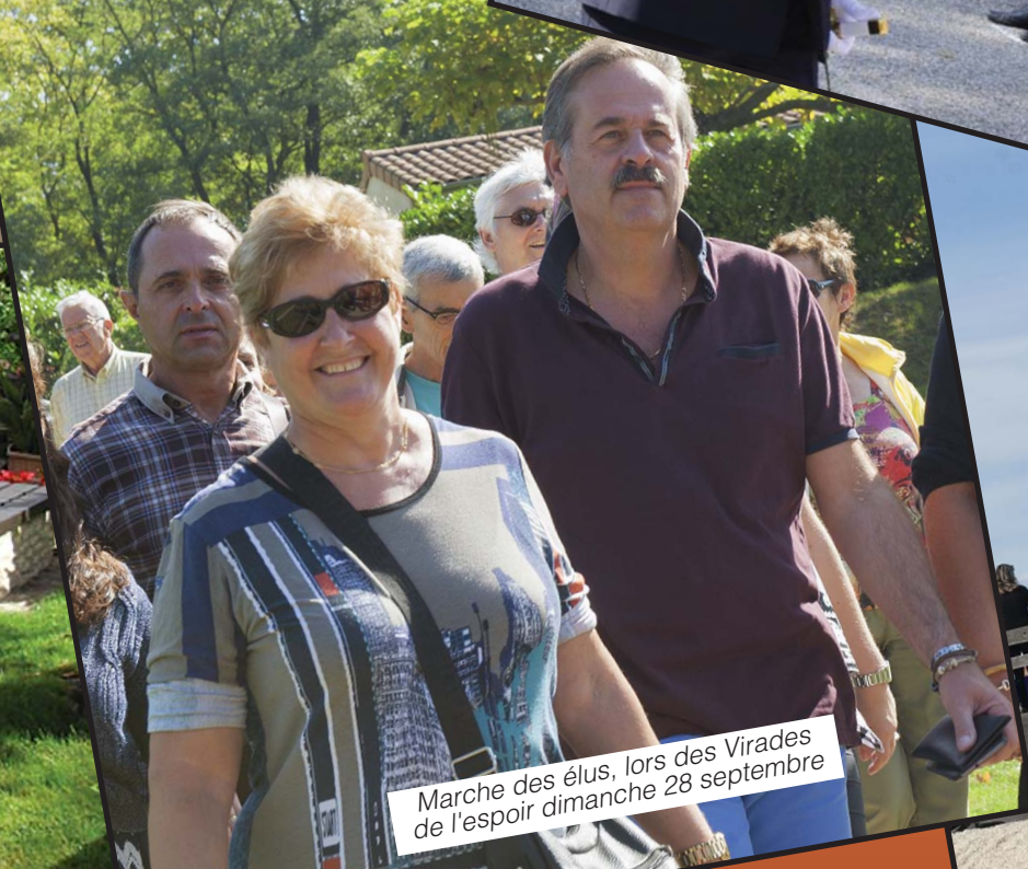
Marche des élus, lors des Virades de l'espoir dimanche 28 septembre