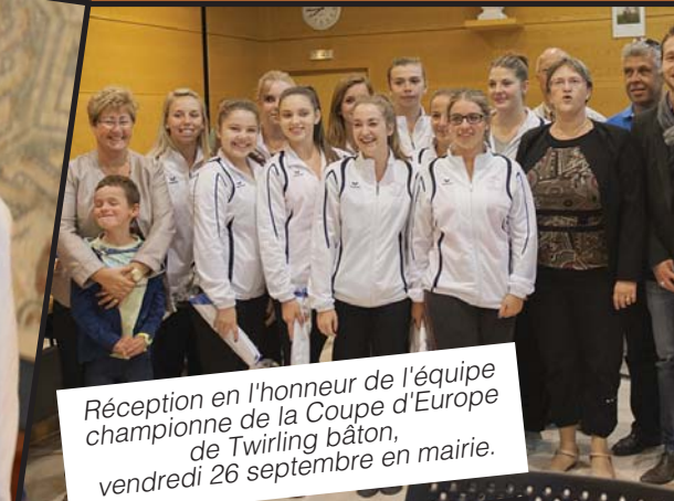
Réception en l'honneur de l'équipe championne de la Coupe d'Europe de Twirling bâton, vendredi 26 septembre en mairie.