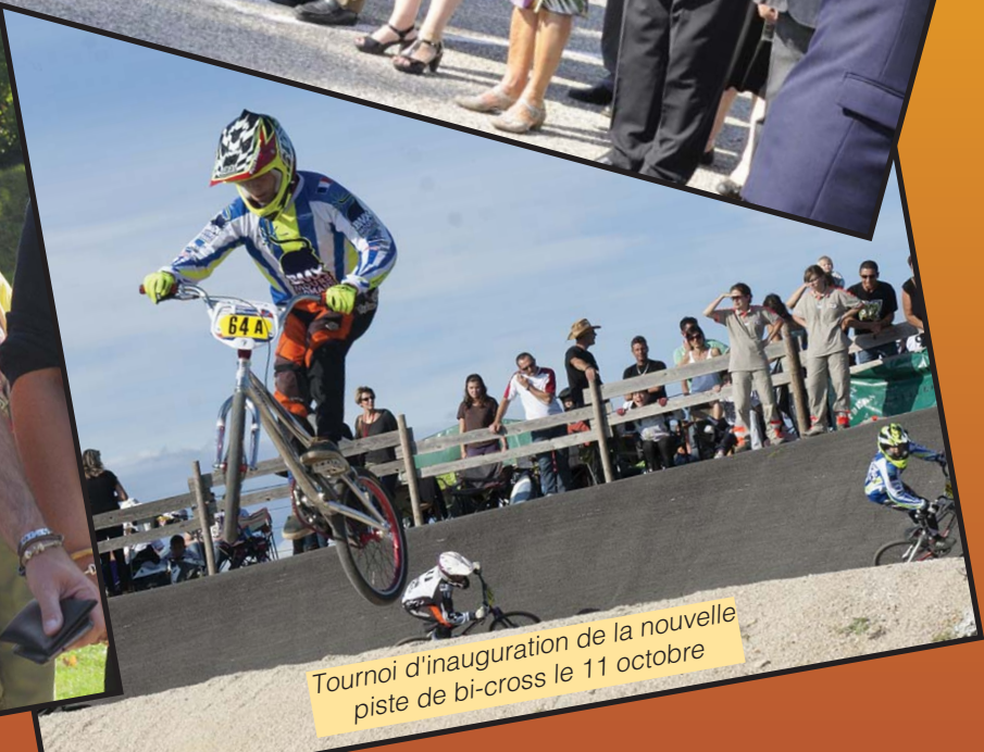
Tournoi d'inauguration de la nouvelle piste de bi-cross le 11 octobre