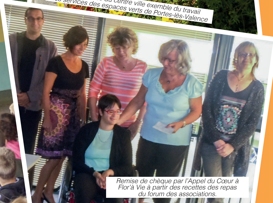
Remise de chèque par l'Appel du Cœur à Flor'à Vie à partir des recettes des repas du forum des associations.