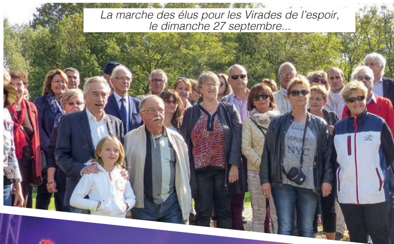
La marche des élus pour les Virades de l'espoir, le dimanche 27 septembre...