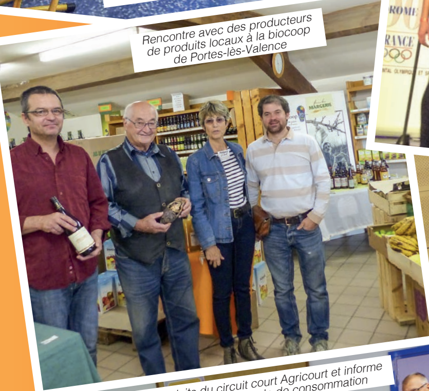
Rencontre avec des producteurs de produits locaux à la biocoop de Portes-lès-Valence