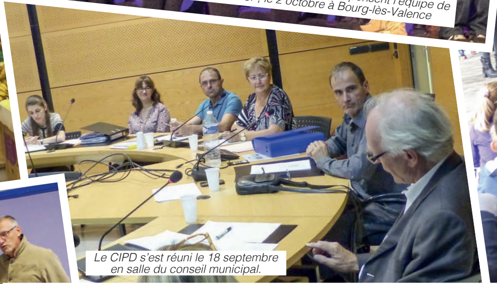
Le CIPD s'est réuni le 18 septembre en salle du conseil municipal.