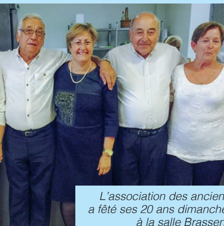
L'association des anciens portois a fêté ses 20 ans dimanche 4 octobre à la salle Brassens