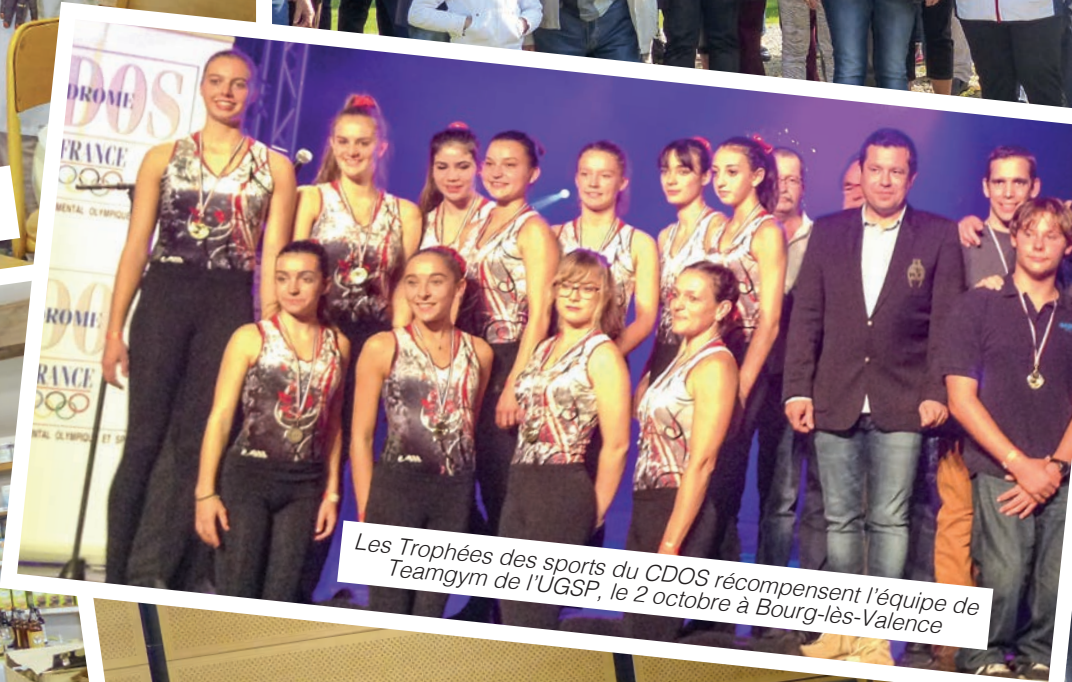
Les Trophées des sports du CDOS récompensent l'équipe de Teamgym de l'UGSP, le 2 octobre à Bourg-lès-Valence