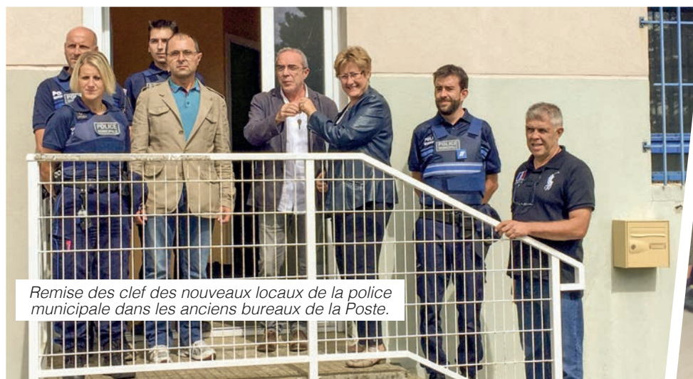
Remise des clef des nouveaux locaux de la police municipale dans les anciens bureaux de la Poste.