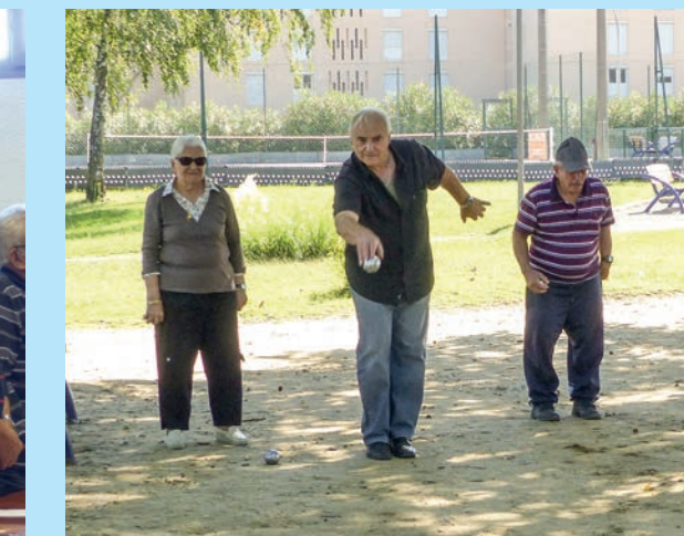
Le Club Ambroise Croizat a terminé sa saison pétanque le vendredi 18 septembre