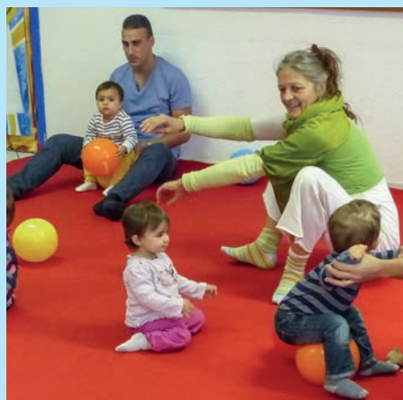
Lancement des ateliers Zimboom à la MJC, activité de découverte corporelle et sensorielle pour les petits de 1 à 3 ans avec leur parent ou leur nounou.