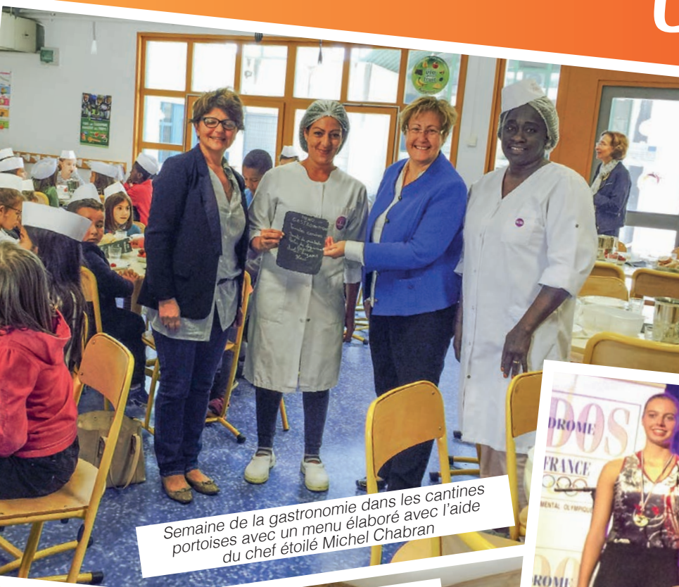
Semaine de la gastronomie dans les cantines portaises avec un menu élaboré avec l'aide du chef étoilé Michel Chabran