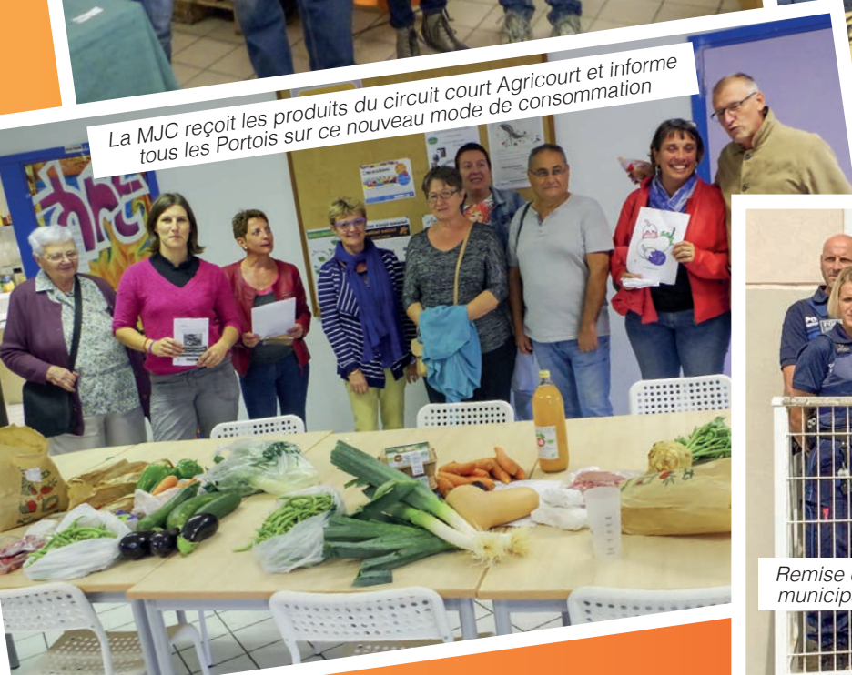
La MJC reçoit les produits du circuit court Agricourt et informe tous les Portois sur ce nouveau mode de consommation