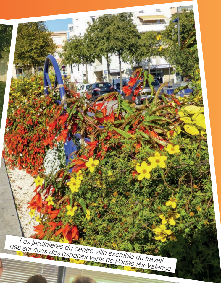
Les jardinières du centre ville exemple du travail des services des espaces verts de Portes-lès-Valence