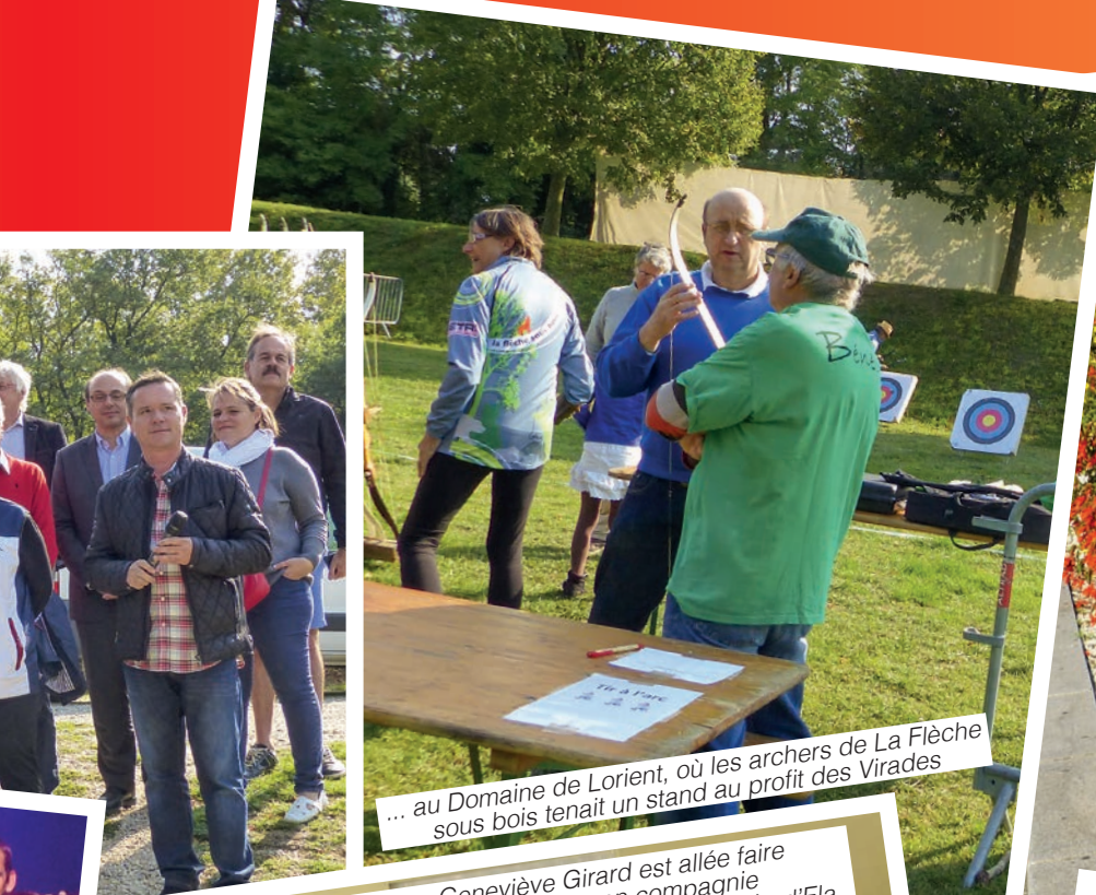
... au Domaine de Lorient, où les archers de La Flèche sous bois tenait un stand au profit des Virades