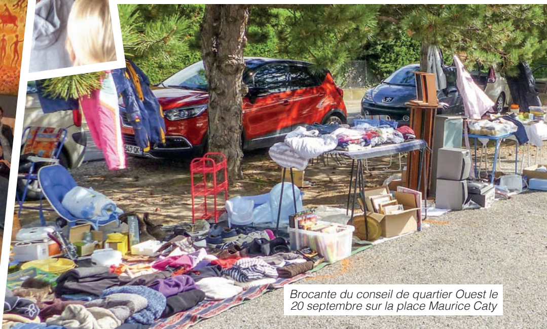
Brocante du conseil de quartier Ouest le 20 septembre sur la place Maurice Caty