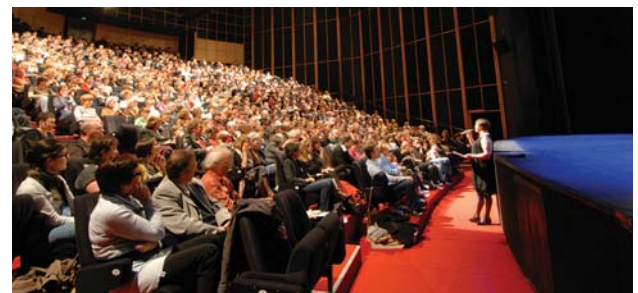
Salle du Lux, scène nationale

Tarifs et informations sur le site du Festival : www.scenarioaulongcourt.com