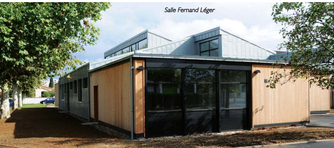
Salle Fernand Léger

Enfin, l'Agenda 21 a été l'opportunité pour la municipalité de s'interroger sur son fonctionnement avec la volonté d'être exemplaire. Plusieurs démarches ont été mises en œuvre afin d'encourager des changements de comportement dans les services avec notamment une meilleure gestion des déchets des services ou bien encore l'intégration de critères environnementaux dans les marchés publics.