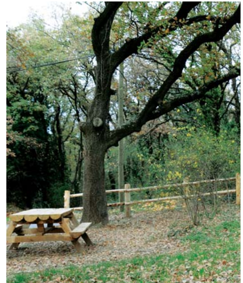
Bois de la Chaffine

La création de l'épicerie sociale et solidaire en est un exemple. Ouverte le 3 janvier 2012, l'épicerie fonctionne de manière coordonnée entre le CCAS et une équipe de bénévoles. Fin 2011, un groupe de travail a également été créé, réunissant le CCAS, la Mairie, le Centre social et des porteurs de projets, pour mener à bien le projet de création de jardins familiaux partagés.